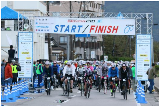
スタート風景(佐和田)