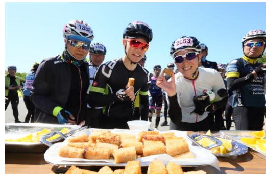
エイドステーション(はじきの)